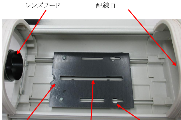
カメラ固定用板 カメラ固定用ネジ穴 筐体固定用ネジ